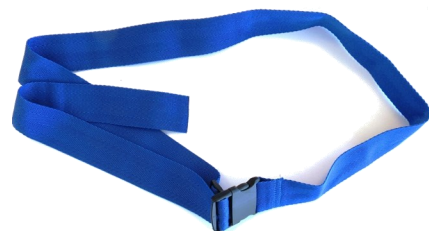
491012 Ceinture pelvienne