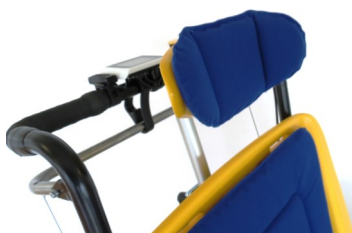
490025 Appui-tête à attache rapide