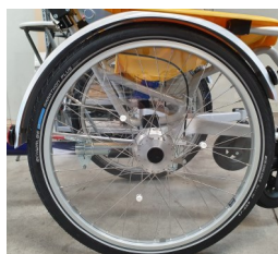
491003 Flasques de roues pour fauteuil roulant, transparentes et résistantes