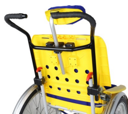
Vue arrière de la coque