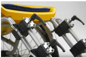
491023 Repose-pieds à attache rapide