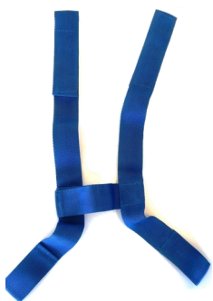
491011 Ceinture de sécurité 4 points.

Les références précédées d'un « S » (standard) désignent les équipements inclus dans le tarif de base.