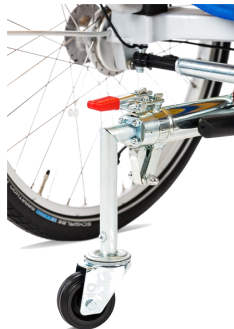
491046 Anti-kiepwiel, aankoppelbaar