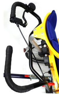
Zicht op stuur met bel en remhendel