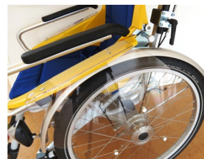
491007 Handbescherming (niet bij hoepels)