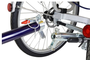
Standaard : afkoppeling