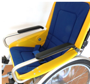
491006 Verhoogde armsteun-set, bekleed en afneembaar