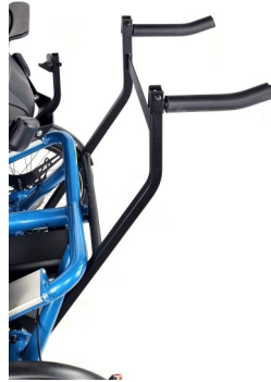
Support pliable fauteuil roulant ou déambulateur option