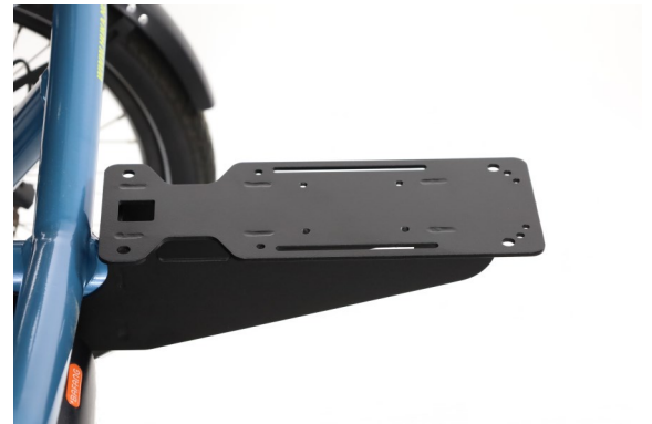
Porte-bagages simple option