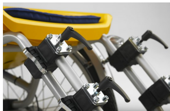
491023 Repose-pieds à attache rapide