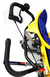
Vue du guidon avec sonnette et poignée de freins