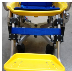
491014 Bande molletière