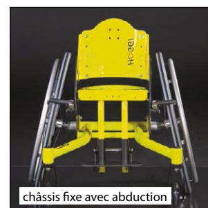
châssis fixe avec abduction