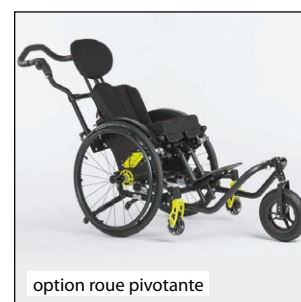
option roue pivotante