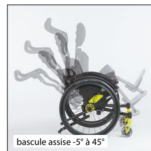
bascule assise -5° à 45°